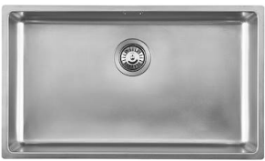
Évier KE - R15 Vintage 2157 080