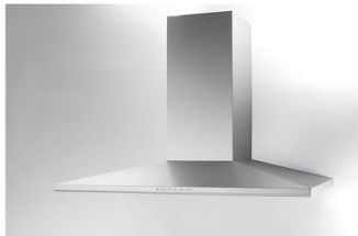
Hotte d'aspiration Amélie 2447 090